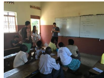
Hoe gebruiken we een witbord?