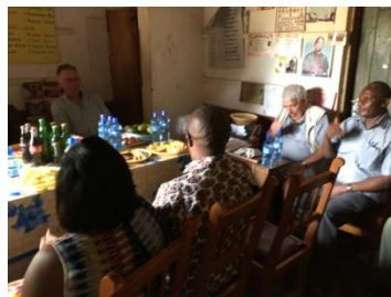
Overleg met de ingenieurs en de lokale partners