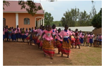
Ontvangst door de leerlingen met zang, muziek en dans

Het werkbezoek was enerzijds noodzakelijk om de uitgevoerde werken te evalueren en anderzijds om een inventarisatie te maken van de lokale situatie op gebied van gebouwen, terrein en omgeving, watervoorziening, elektriciteitsvoorziening en internet en de mogelijkheden te onderzoeken om deze uit te bouwen in de toekomst.